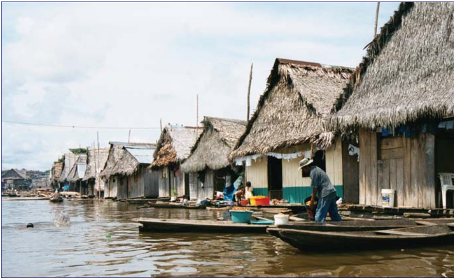
Woonboten (balsas) aan de Amazone Rivier bij Iquitos. In een ervan is het hoofdkwartier van Dignidad gevestigd.