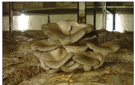
Gecultiveerde oesterzwammen als product van Elok Basamo

tijd haar rol zullen gaan overnemen en met hulp van de lokale autoriteiten, worden groepen vrouwen geselecteerd. Zij worden opgeleid om een klein bedrijf zelfstandig te kunnen uitoefenen (denk aan land- en tuinbouw, kleding fabricage, kruidenhandel etcetera). Belangrijk is dat ze leren omgaan met geld, te plannen en dus te sparen. Groepen vrouwen vormen samen micro-bankjes (Bancos Comunales) die het budget voor leningen aan de groep beheren. Zodra een lening is terugbetaald is geld in kas om een andere vrouw uit de groep een lening te verstrekken. Zero-Kap besloot de aanvraag voor