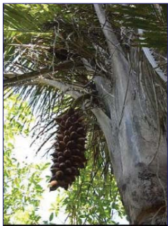
De palm die in Guarayos in grote dichtheden voorkomt wordt in Bolivia 'Cusi' genoemd.

gescheiden van het zetmeel. Het residu en de schil kan worden omgezet in houtskool. De olie heeft potentieel toepassing in de voedingsmiddelenindustrie, is de basis van zeep en shampoo, maar is op dit moment vooral veel waard als biobrandstof. De zetmeel is een hoogwaardig veevoer. De houtskool is zeer goed bruikbaar in de staalindustrie. Een bedrijfsplan werd opgezet om de noten industrieel te gaan verwerken en afnemers werden gevonden voor de olie en de houtskool in Brazilië en het zetmeel wordt afgenomen door lokale veetelers. De fabriek wordt gefinancierd o.a. door Cordaid. Parallel met dit project werd een woningbouwproject gestart, want de boeren verzamelaars gaan hun inkomen verdubbelen (tot zo'n 24 per dag) en hun eerste behoefte is betere huizen om in te wonen en schuren om hun werktuigen in op te slaan. De